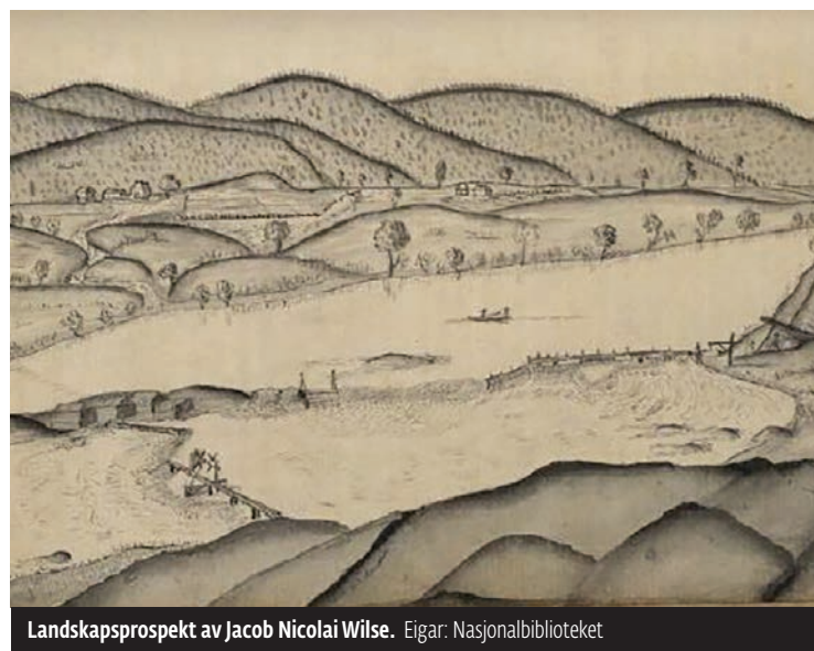
Landskapsprospekt av Jacob Nicolai Wilse.